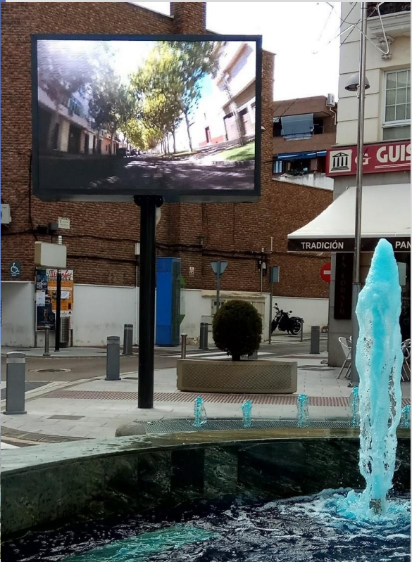
Villanueva de la Serena